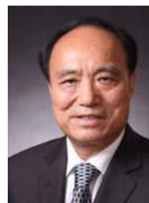
Houlin Zhao Generalni sekretar ITU

Standardi nas povezujejo z zanesljivimi načini komuniciranja, kodeksi ravnanja in z zaupanja vrednimi okviri sodelovanja. Ko standardi uvajajo skupne razlage na obeh straneh komuniciranja ali trgovanja, so bistvenega pomena za obojestransko koristno trgovino in vir učinkovitega mednarodnega trgovanja.